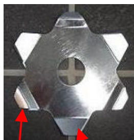
下刃 上刃 平ヤスリで目立て可能

あなたは、刈払機に8枚刃、チップソー、笹刈刃等の金属刃をつけて刈払い作業をしますか？ あなたは、ツル草やカヤや熊笹等の長い雑草類を刈払う作業をしますか？ 刈払作業中にツル草やカヤや熊笹等がギアケースに巻付いて困ったことはないですか？