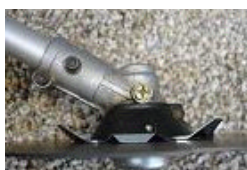
使用前 上刃も下刃も鋭利！

そんな作業には、この巻付かずくんが最適ですよ！！ 巻付こうとするツルやカヤや笹や柔らかい草を切って、巻付きを防ぎます！！